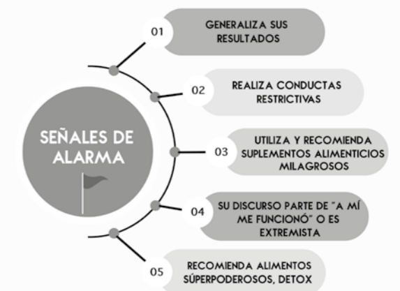
Figura 1. Identificación de señales de alarma en influencers de estilo de vida saludable para disminuir el desarrollo de conductas alimentarias de riesgo (imagen: creación propia).

Adicionalmente, se debe tomar en cuenta que un creador publica en su día a día sus comidas comúnmente bajas en calorías, sus rutinas de ejercicio, fotografías personales, suele mostrarse feliz y positivo, comparte los productos que diversas marcas le regalan, viaja en múltiples ocasiones, etcétera; pareciera la vida perfecta ¿no? Pero, ¿qué pasa con las fans que no practican este estilo de vida?, ¿qué pudiera ocasionar al exponerse a esta información? El interés por imitar a un influencer con un cuerpo delgado y estético (en su mayoría fotografías editadas) puede generar insatisfacción y un ambiente con una gran cantidad de estímulos aversivos, además de una alta probabilidad de que los seguidores realicen conductas alimentarias de riesgo (CAR).