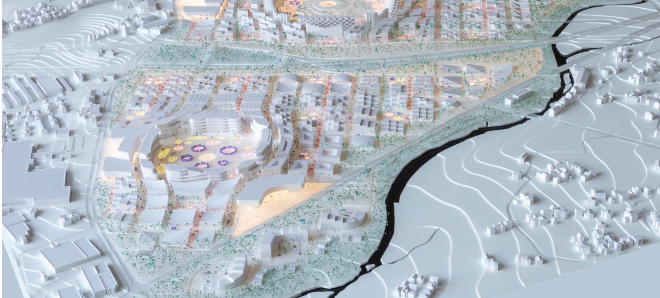
Toyota Woven City, Bjarke Ingels.

nómico-industrial va de la mano con el desarrollo de un nuevo modelo educativo –Educación 4.0– en el que se debe priorizar la capacitación de profesionales con conocimientos interdisciplinarios para el manejo de las tecnologías y con capacidad de cooperación constante con otros agentes como las empresas, las instituciones gubernamentales, educativas y de la sociedad civil. En el caso de América Latina, se tiene un fuerte rezago educativo que, aunado a las nuevas tendencias y necesidades de la industria, puede llegar a incrementar la exclusión social como resultado de la analfabetización tecnológica (Lafont Mendoza et al. , 2021; Ulloa-Duque et al. , 2020). En este sentido, países como Japón, que han estado impulsando estas transformaciones en la educación superior para aprovechar y estar a la vanguardia de las necesidades de la Industria 4.0 (Deguchi, Akashi, et al. , 2020), pueden servir de modelos de estudio.