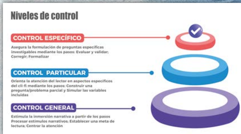
Figura 2. Niveles de control de lectura de ficción climática.