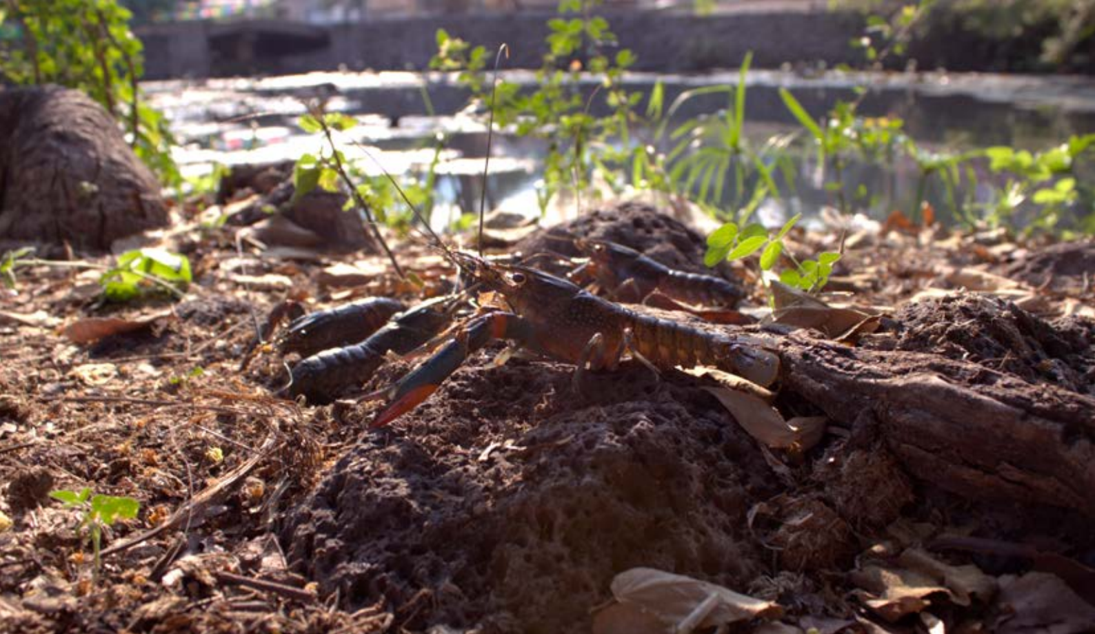
Figura 1. Langostino australiano ( Cherax quadricarinatus ) extraído en los manantiales de Concá.

En México, la introducción tuvo dos etapas: la primera sucedió en 1986 a través de una empresa que tenía como propósito cultivarlo y comercializarlo en el estado de Querétaro, sin lograr resultados favorables, ya que todos los ejemplares murieron en el trayecto; la segunda fue en 1995 con organismos que se trajeron a la Planta Experimental de Producción Acuícola de la Universidad Autónoma Metropolitana, Unidad Iztapalapa, en la Ciudad de México, y al Centro de Investigación y Estudios Avanzados del Instituto Politécnico Nacional, Unidad Mérida, en Yucatán, con el fin de proyectar su viabilidad en policultivos con otros organismos dulceacuícolas.