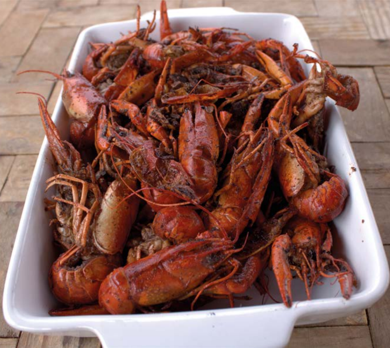
Figura 4. Plátido local usando como ingrediente principal el langostino australiano.

Es por ello que se analiza la viabilidad de que los emprendedores locales los aprovechen con el establecimiento de un mercado que posibilite su comercialización, utilizando diversas herramientas con el fin de lograr una eliminación progresiva en los ambientes naturales, con el plan, a mediano plazo, de crear granjas acuícolas especializadas en esta especie invasora y otras nativas, principalmente la "acamaya".