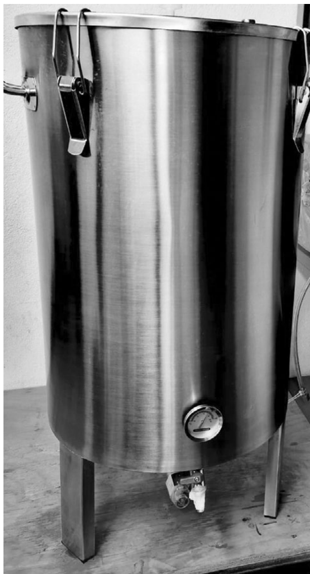
Figura 1. Fermentador FOSHAN DM-F700.

Durante la fermentación se realizó la medición de ácido láctico según el método descrito en la NMX-F-420-1982. Para verificar las fases de la cinética del crecimiento microbiano se realizó el conteo en placa cada tres días usando el medio de cultivo de Man, Rogosa y Sharpe (MRS) específico para Lactobacillus spp.