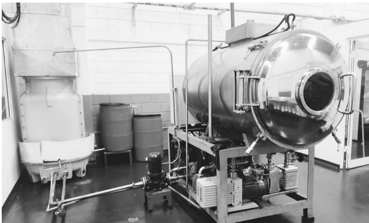
Figura 2. Liofilizador KEMOLO FD-50.