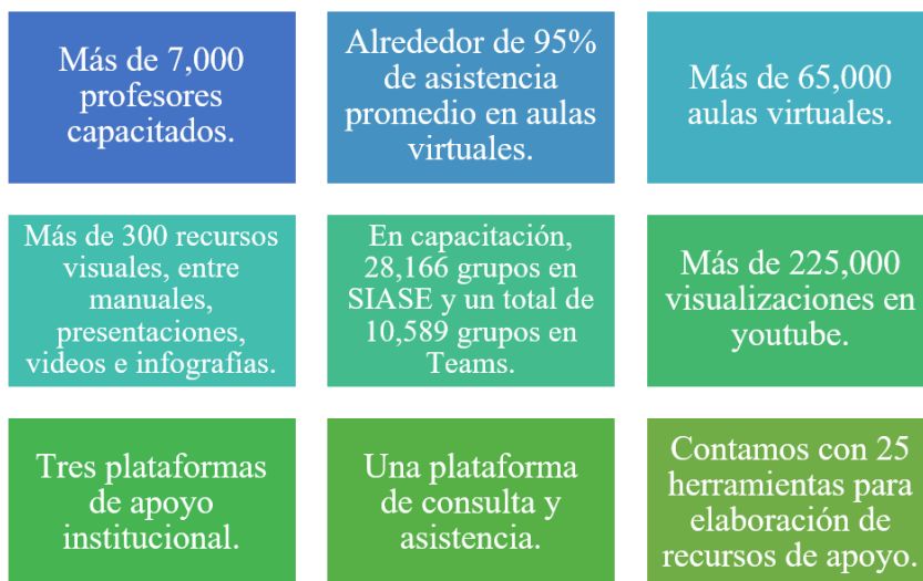
Figura 2. Impacto de la Estrategia Digital.

nómico, equipamiento tecnológico, salud socioemocional, movilidad y transporte, relaciones sociales y educación digital; los resultados arrojados permitirán dar continuidad a la propuesta de implementación de un modelo híbrido como una alternativa a los métodos de enseñanza. En la figura 2 podemos ver el impacto de la Estrategia Digital UANL hasta el momento.