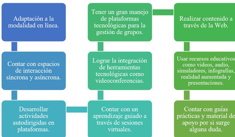
Figura 1. Características que conforman la Estrategia Digital UANL.

La pandemia por SARS-CoV-2 ha afectado a nivel mundial en aspectos como la salud, la economía, la educación y otros factores sociales. A causa de esto, la UANL propone la implementación de la Estrategia Digital con el apoyo de las autoridades, con el objetivo de dar seguimiento y continuidad al ciclo escolar y captar la atención de toda la comunidad universitaria, para lograr el aprovechamiento de los recursos tecnológicos y de comunicación que se facilitan hoy en día.