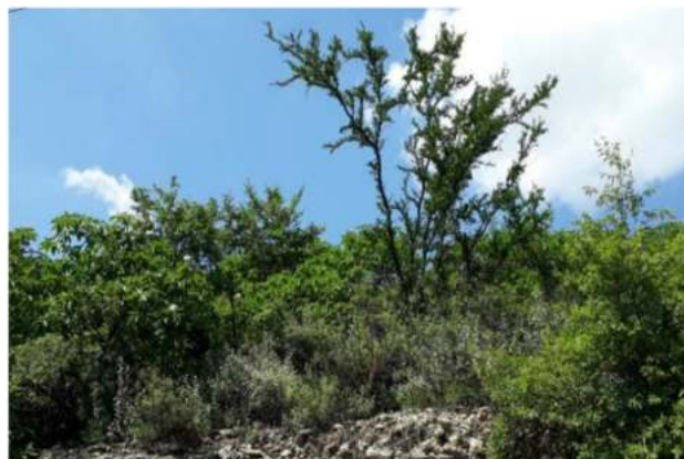
Figura 2. Estratificación del matorral subinermes con Acacia rigidula , Cordia boissieri y Neopringlea integrifolia .