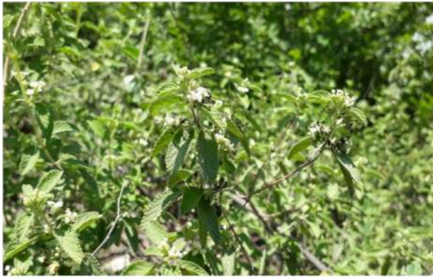
Figura 3. Orégano chino Lippia graveolens en floración.