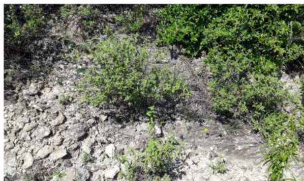
Figura 1. Condición ambiental en donde es común encontrar al orégano chino Lippia graveolens .

La vegetación tiene una fisonomía de matorral abierto de entre dos a 3.5 m de altura, con elementos subinermes y un estrato superior dominado por especies arbustivas como el chaparro prieto Acacia rigidula , anacahuita Cordia boissieri , cenizo Leucophyllum frutescens , guajillo Acacia berlandieri , gobernadora Larrea tridentata , y corvagallina Neopringlea integrifolia (figura 2). Especies eminentes como el mezquite Prosopis glandulosa y Yucca filifera pueden presentarse de manera aislada en zonas de transición con otros tipos de vegetación. Un estrato subarborescente menor a 1 m de altura en donde destacan especies como lechuguilla Agave lechuguilla , Lantana canescens , Lantana velutina , damiana Turnera diffusa y sangre de drago Jatropha dioica y el orégano chino Lippia graveolens (figura 3) forman parte de ese estrato. En el estrato herbáceo dominan especies como Aristida purpurea , Polygala lindheimeri , parraleña Thymophylla pentachaeta y ojo de víbora Evolvulus alsinoides .