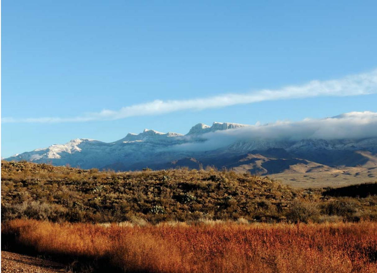
Serranía Maderas del Carmen, Coahuila.

negro en la Sierra de Picachos, en el noreste de México, constó de componente vegetal. Moreno 30 encontró una menor diversidad (17 componentes alimenticios) en la dieta del oso negro en Sonora y Chihuahua.